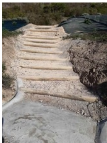
Réalisation d'un escalier pour la descente du parking de l'aire de jeux.