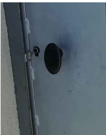
Réparation de la porte du réservoir, suite à une dégradation.