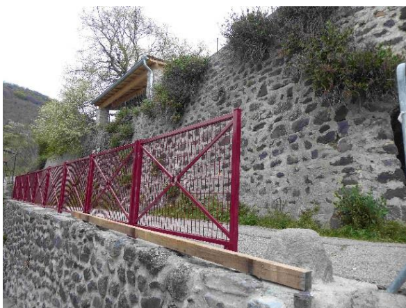
Pose d'une barrière de protection place du Lavoir.

L'épaveuse rouge est affectée à la propreté des bords de routes : 25 kms de voies communales tout de même !