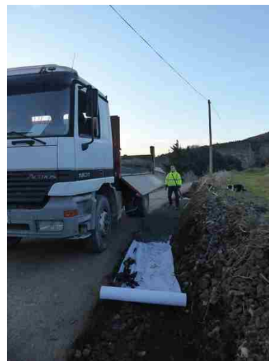
Élargissement du chemin de la Cantonne et de Fontgiraud