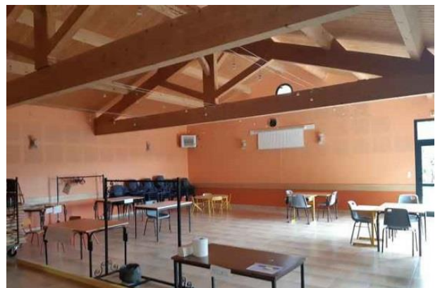
Salle polyvalente aménagée pour le périscolaire