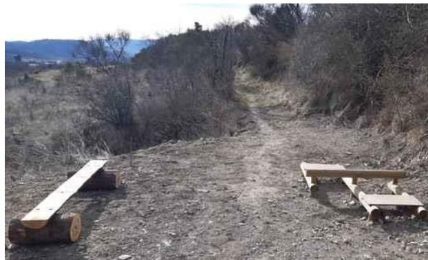
Réalisation de bancs pour le parcours de santé