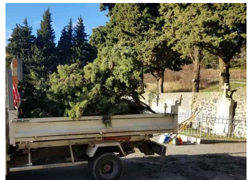
Élagage des cyprès au cimetière