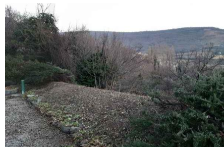
Débroussaillage de l'espace basalte