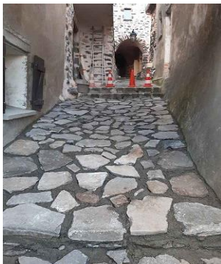
Jointement de la rue des Arceaux