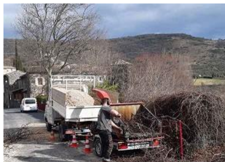
Broyage du tilleul sur place