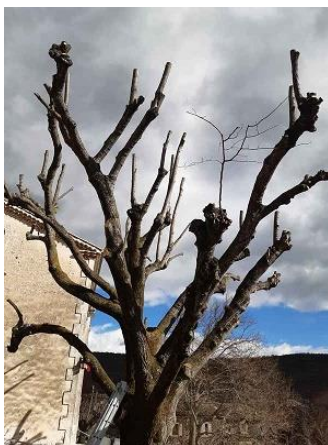
Élagage du tilleul de l'école