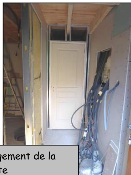
Rénovation du logement de la Placette