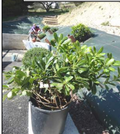
Aménagements paysagers derrière la nouvelle cour d'école