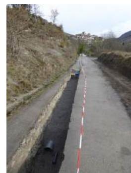
Raccordement du village à la station à roseaux