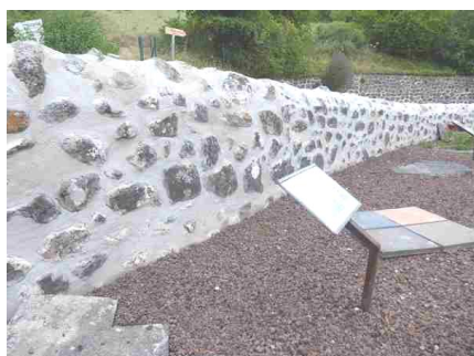
Rénovation du mur d'enceinte de l'« Espace Basalte »