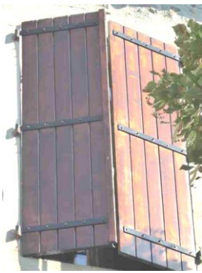
Réfection des volets du bâtiment mairie école