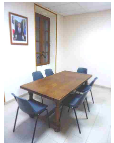
Aménagement d'une nouvelle salle de réunion