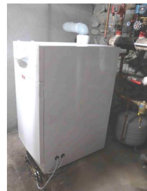
Changement de la chaudière mairie école pour économie d'énergie dans l'ensemble du bâtiment