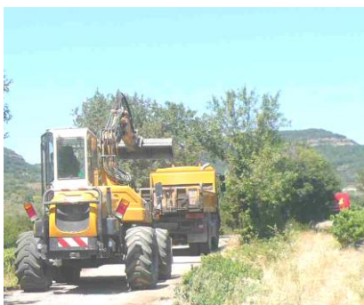
Travaux de voirie : chemin de la Cantonne, route de Freyssenet, chemin du Tunnel