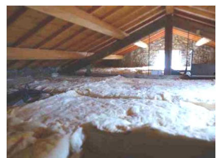
Isolation des combles de la mairie pour économie d'énergie