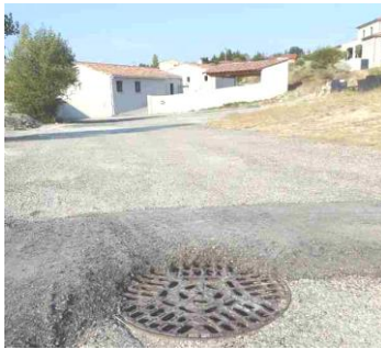
Réorganisation de la circulation des eaux pluviales impasse Chante Mûre