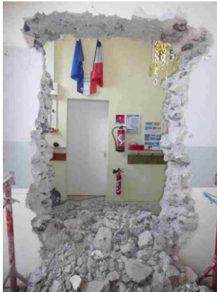
Ouverture d'une porte pour communication interne au RdC du bâtiment mairie école