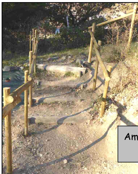
Aménagement d'un sentier d'accès à la cour de l'école