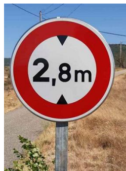
Pose d'un panneau de limitation de hauteur sur le chemin de Fongiraud