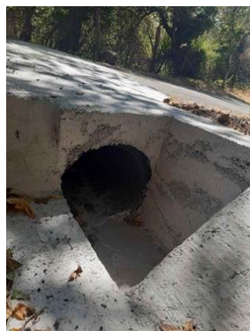
La route du Coiron