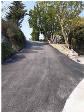
La montée de l'église