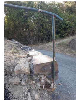
Réparation de la rampe de la montée de l'église