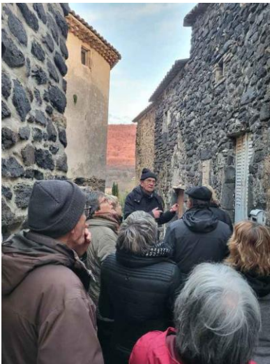
Visite du village