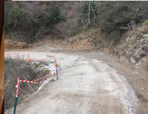
Elargissement du chemin des Combes pour permettre aux véhicules de passer sans difficulté ce passage étroit.

LES COMPOSTEURS : installés à l'Espace Basalte, ils serviront aux habitants du village qui n'ont pas de jardin.