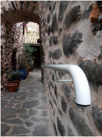
Installation d'une rampe rue des Arceaux