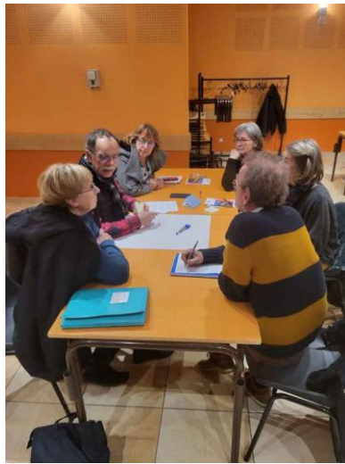
Un groupe travaillant sur la préparation du plan d'action de l'OT 2023-2026

Le Comité de Direction de l' Office de Tourisme Intercommunal PORTE SUD ARDECHE s'est tenu le lundi 6 février à Aubignas.