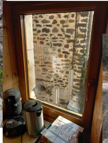
Installation d'une nouvelle fenêtre à la bibliothèque pour une meilleure isolation du local.