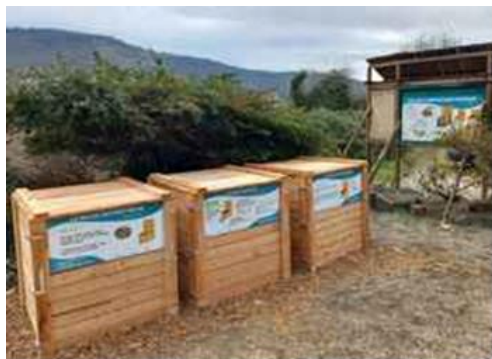
Installation de 3 composteurs Espace Basalte.