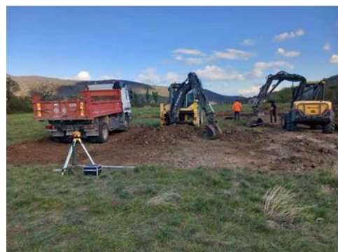
Terrassement du Parc Multi Sport à l'ancien terrain de foot.