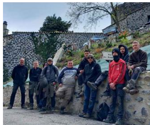
Fin des travaux de l'aménagement du vieux cimetière par les stagiaires du CFPPA du Pradel.