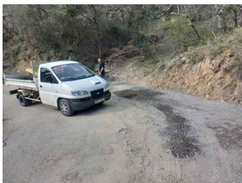
Elargissement du chemin des Combes pour assurer la sécurité du virage.