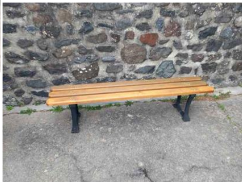
Remise en place du banc derrière le mur de l'église.