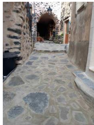
Travaux rue des Arceaux : Reprise de la calade sur 10 mètres linéaires avec cuvette en pierre centrale pour évacuation de l'eau et jointement.