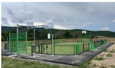
Parc multisports : Les travaux sont terminés, le stade est ouvert à tous et à toutes.