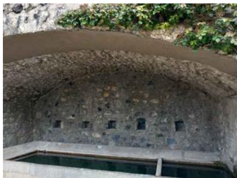
Rejointement de la voute du lavoir.