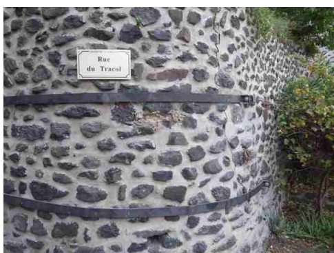
Consolidation du mur de la rue du Tracol.