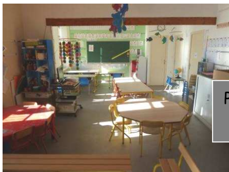
Pose d'un revêtement de sol pour insonoriser la classe maternelle