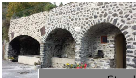
Etanchéité au lavoir